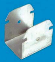
Spojka CD UA 50 - křížová