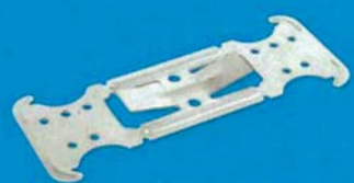
Křížová spojka rovná