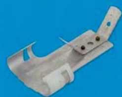
Rychlozávěs pérový čtyřbodový K 05 PL