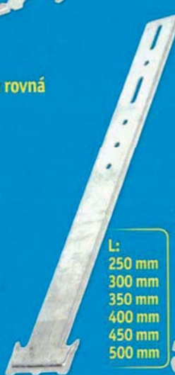
L: 250 mm 300 mm 350 mm 400 mm 450 mm 500 mm