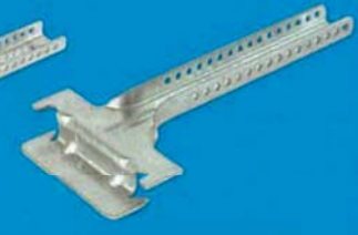
Nonius spodní díl 135 mm