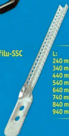
Nonius vrchní díl