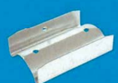
Spojovací kus pro CD prohnutý