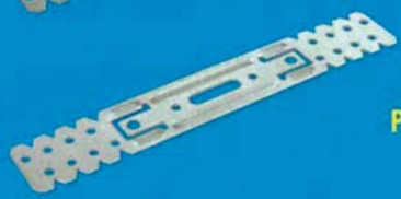
Přímý závěs 55 mm