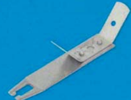
Rychlozávěs pérový pro hl. T profil - S10