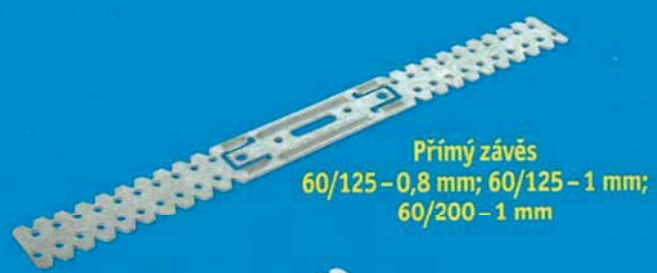
Přímý závěs 60/125 - 0,8 mm; 60/125 - 1 mm; 60/200 - 1 mm