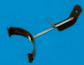
Pružinový závěs CD profilu-SSC 100