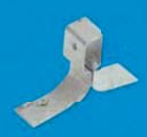
Pérko minerál 25