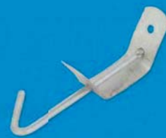
Závěs minerálního podhledu - SHUT 0100