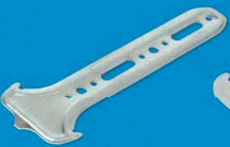
Závěs CD krokrový N 170 mm