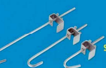
Svorka nosníku 50-85 mm 85-130 mm 130-210 mm