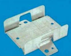
Jezdec CD profilu