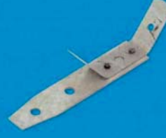
Rychlozávěs pérový pro dřevo