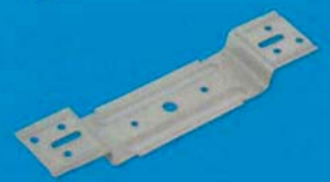
Akustický Stavěcí třmen 35 mm