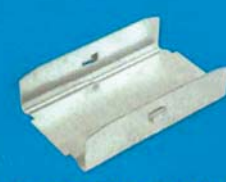
Spojovací kus pro CD 80 mm, 100 mm