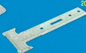
Závěs CD krokrový T 150 mm, T 170 mm