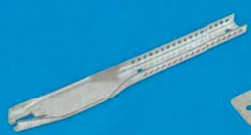
Nonius spodní díl pro T profil