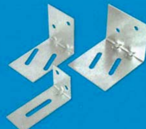
Propojovací úhelník UA 50, UA 75, UA 100