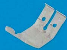
Dvojitá pérová svorka