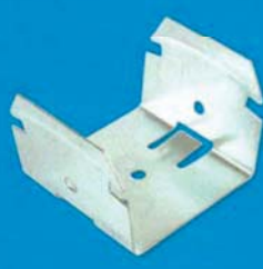
Křížová spojka ohnutá