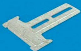
Posuvný závěs CD plochý