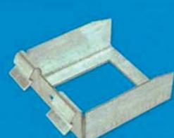
Spojka CD úroňová