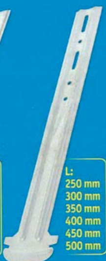
L: 250 mm 300 mm 350 mm 400 mm 450 mm 500 mm