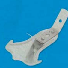
Rychlozávěs pérový zaoblený