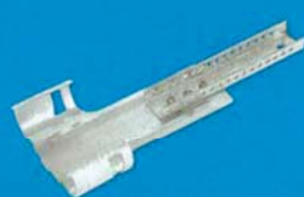
Nonius CD čtyřbodový - spodní