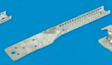
Nonius spodní díl pro dřevo