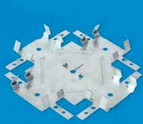
Spojka CD úroňová čtyřbodová