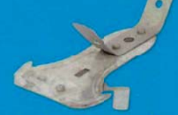
Rychlozávěs pérový zaoblený se zajištěním