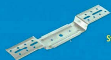
Stavěcí třmen 65 mm