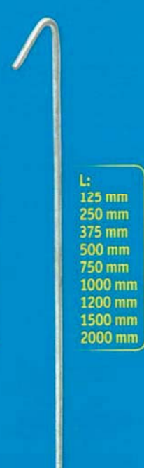
L: 125 mm 250 mm 375 mm 500 mm 750 mm 1000 mm 1200 mm 1500 mm 2000 mm