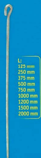
L: 125 mm 250 mm 375 mm 500 mm 750 mm 1000 mm 1200 mm 1500 mm 2000 mm