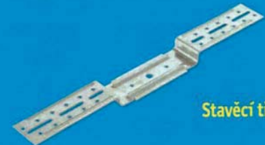
Stavěcí třmen 95 mm