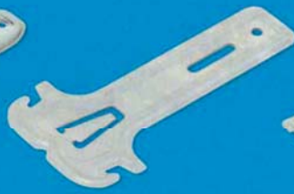
Závěs CD krokrový zaoblený 90 mm, 120 mm, 150 mm, 170 mm