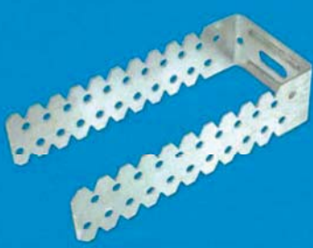
Přímý závěs na dřevo 50 / 125 / 0,8 mm